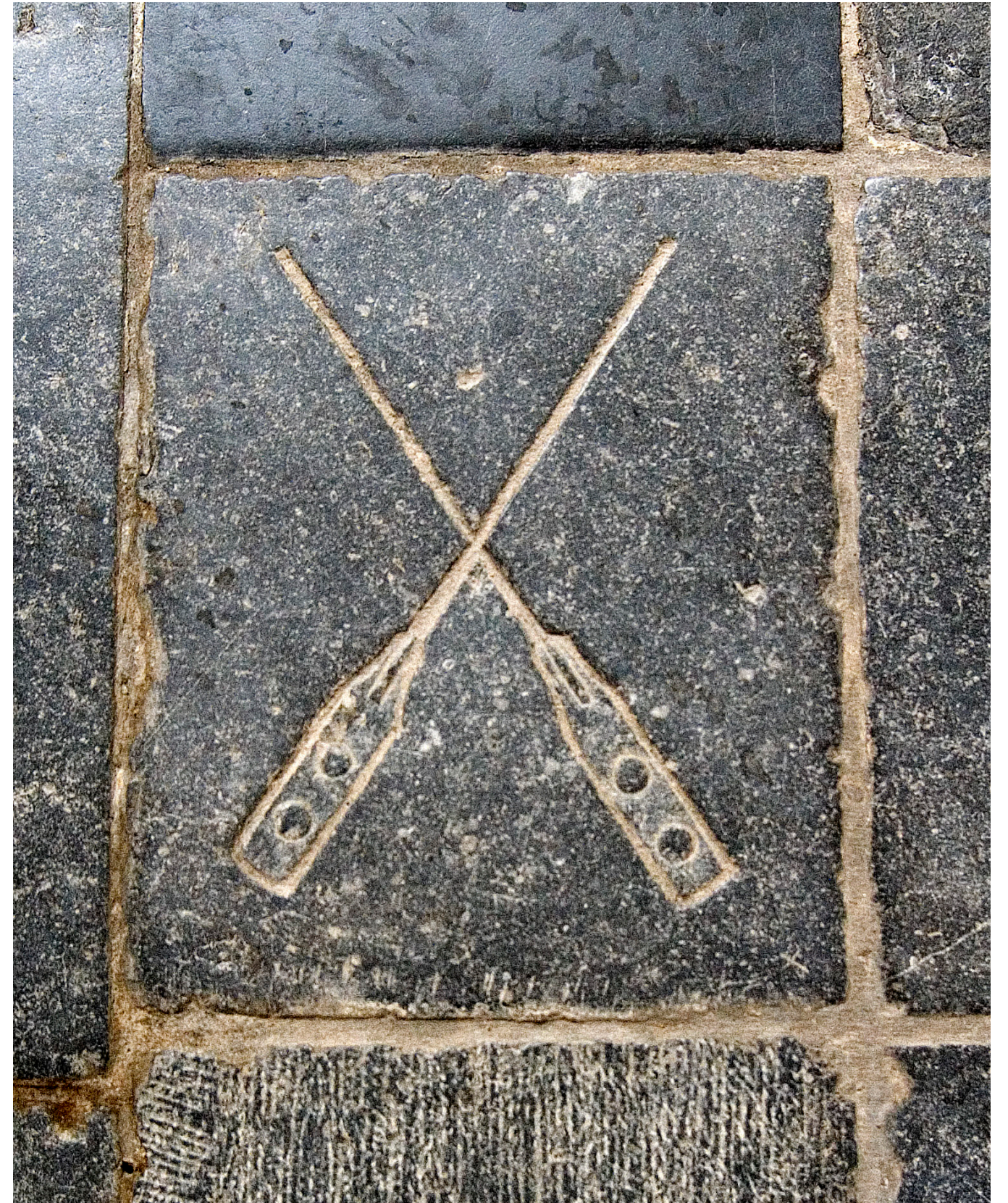
Afb.3 Het gildegraf van de bakkers in de Grote Kerk van Dordrecht