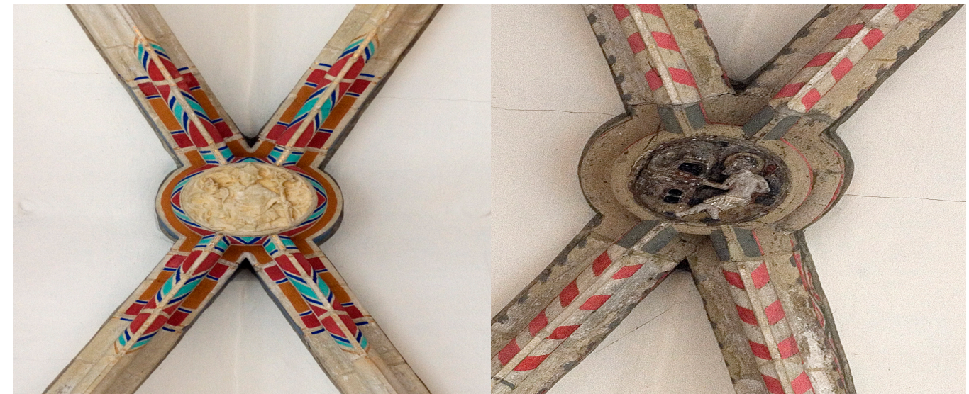
Afb. 4 Rozet van het Sint Nicolaasgilde in de Grote Kerk van Dordrecht Afb. 5 Rozet van het Sint Aubertusgilde

Het gilde zorgde met zijn begrafenischilden, blazoenen en doodskleden niet alleen voor een