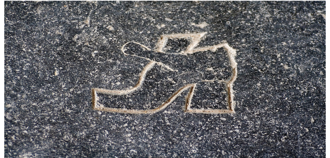
Afb.1 Detail van het gildegraf van de schoenmakers in de Grote Kerk van Dordrecht

U kijkt al een tijdje tegen een foto aan die achter mij is geprojecteerd – een detail van de zerkenvloer uit de Grote Kerk van Dordrecht. Het is een gildegraf, namelijk dat van de schoenmakers. En daarmee stuiten we meteen op een ondergewaardeerd aspect van het gildewezen in de vroegmoderne samenleving. Het moge zo zijn dat het gilde op de eerste plaats een verenigingsband van ambachtslieden was, maar dan moeten we ons wel een voorstelling maken van de betekenis, de zingeving die in de vroegmoderne periode voor de persoonlijke identiteit aan het ambacht werd ontleend. Bij de begrafenis van een gildebroeder stond het gilde pontificaal in het centrum van de belangstelling, niet de familie. Tijdens de zogeheten opheve waren de confraters verplicht acte de présence te geven bij de begrafenis van een gildebroeder. Op afwezigheid stonden boetes die varieerden van vier stuivers in het metselaarsgilde tot twaalf stuivers in het lakenkopersgilde. De gildeknecht, meestal het jongste lid, moest er streng op toezien dat de gildebroeders bij de opheve aanwezig waren. De broeders verzamelden zich voor het huis van de gestorvene, waar de ceel werd voorgelezen, de naamlijst van het gilde. Na het aflezen van de cedel droegen de jongste leden de baar naar buiten. Vervolgens trok de rouwstoet naar het gemeenschappelijke gildegraf. De gildebroeders behoorden in gepaste kledij ter opheve te komen. Zo schreef het lakenkopersgilde een