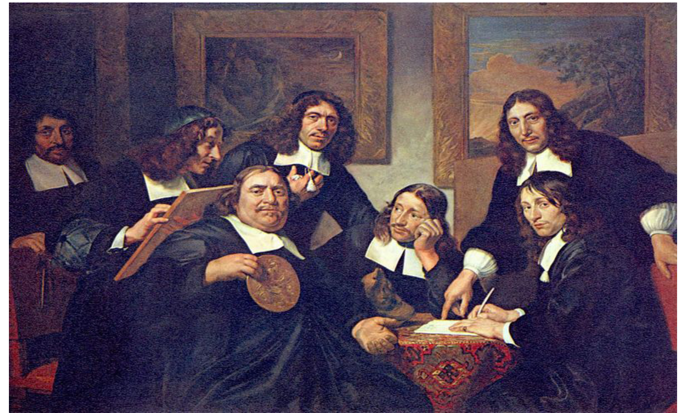
Afb. 7 Jan de Bray: Overlieden van het Haarlemse Sint-Lucasgilde (1675).