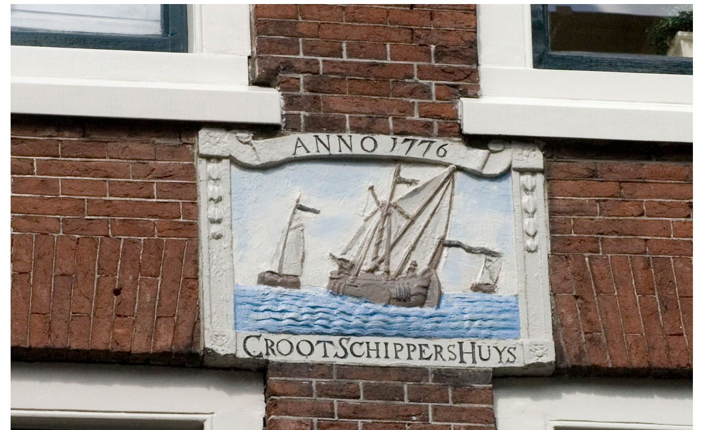
Afb. 10 Gevelsteen van het Grootshippersgilde van Dordrecht

Conflicten waren er ook in de verhouding tussen stad en platteland, in de dominantie van de Dordtse gilden op de handel en nering van de omringende waarden van Dordrecht. Reeds de gildebrieff van 1367 kende de Dordtse gilden het gildemonopolie toe binnen der stede vrihit , en Karel V verbood in zijn Order op de Buitenningen van 1531 de oprichting van weverijen, leerlooierijen, metsel – en timmerwerkplaatsen zonder het consent van de gilden binnen