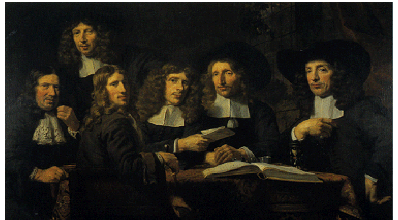
Afb. 8 Nicolaas Maes: Overlieden van het