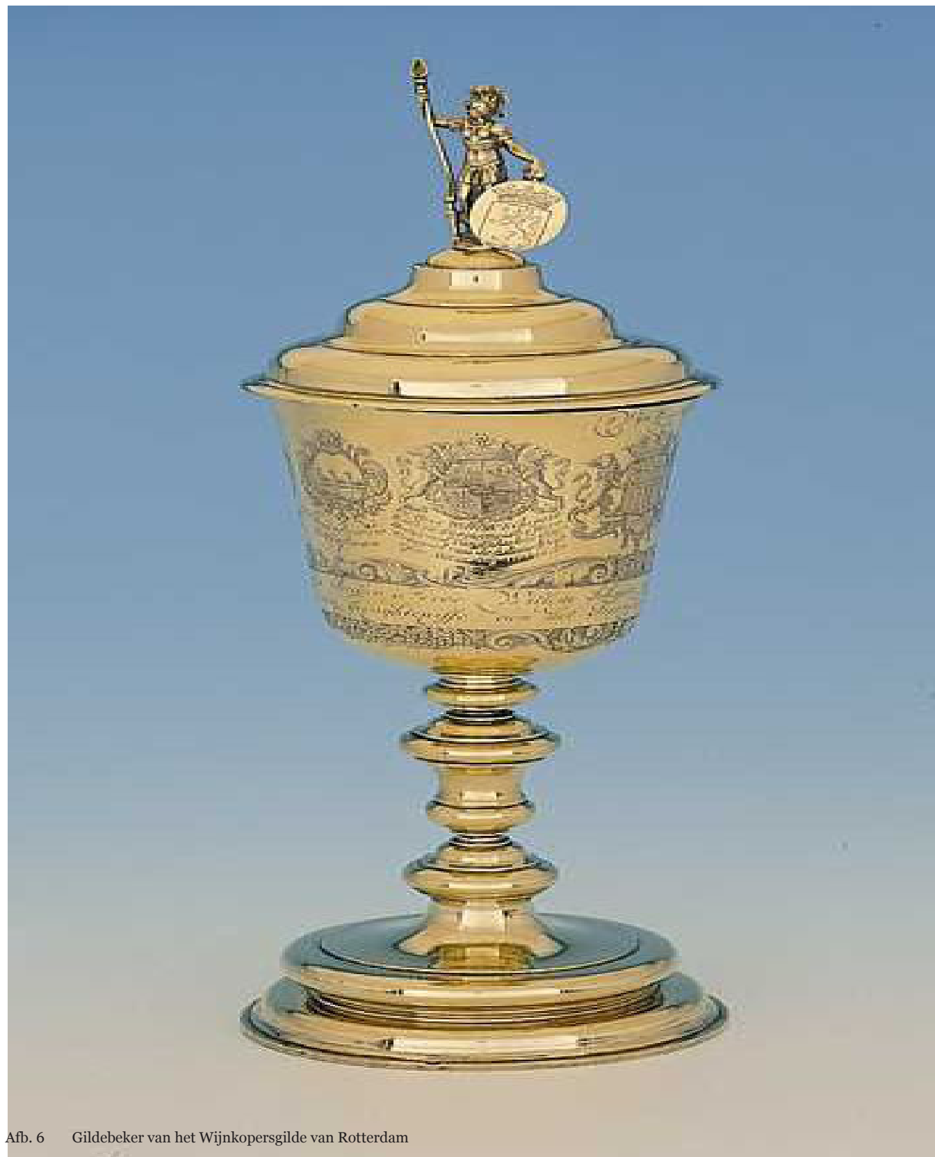
Afb. 6 Gildebeker van het Wijnkopersgilde van Rotterdam

toegangspoort en aan de linkerzijde van de voorgevel en het riviergezicht aan de rechterzijde. De gevelstenen van de oude gildehuizen van de grootschippers treffen we in de Wijnstraat aan, op nummer 19 om precies te zijn, en die van het kleinschippers aan de Riedijk nummer 100. In de schilderkunst van de zeventiende en achttiende eeuw is het sociabiliteitsaspect van het gildewezen – naast de vereeuwiging van de dekens van het gilde, met topstukken als Overlieden van het Haarlemse Sint-Lucasgilde van Jan de Braij uit 1675 en de Overlieden van het Amsterdamse chirurgijngsgilde van Nicolaes Maes uit 1680 – een geliefd thema, denk aan de Anatomische Les van Rembrandt uit 1632 of die van Cornelis Troost uit 1728. Het jaarlijkse ritueel van de vrolijke maaltijden heeft een schat aan materiële cultuur opgeleverd, want in de aanschaf van bestek en serviesgoed werden kosten noch moeite gespaard.