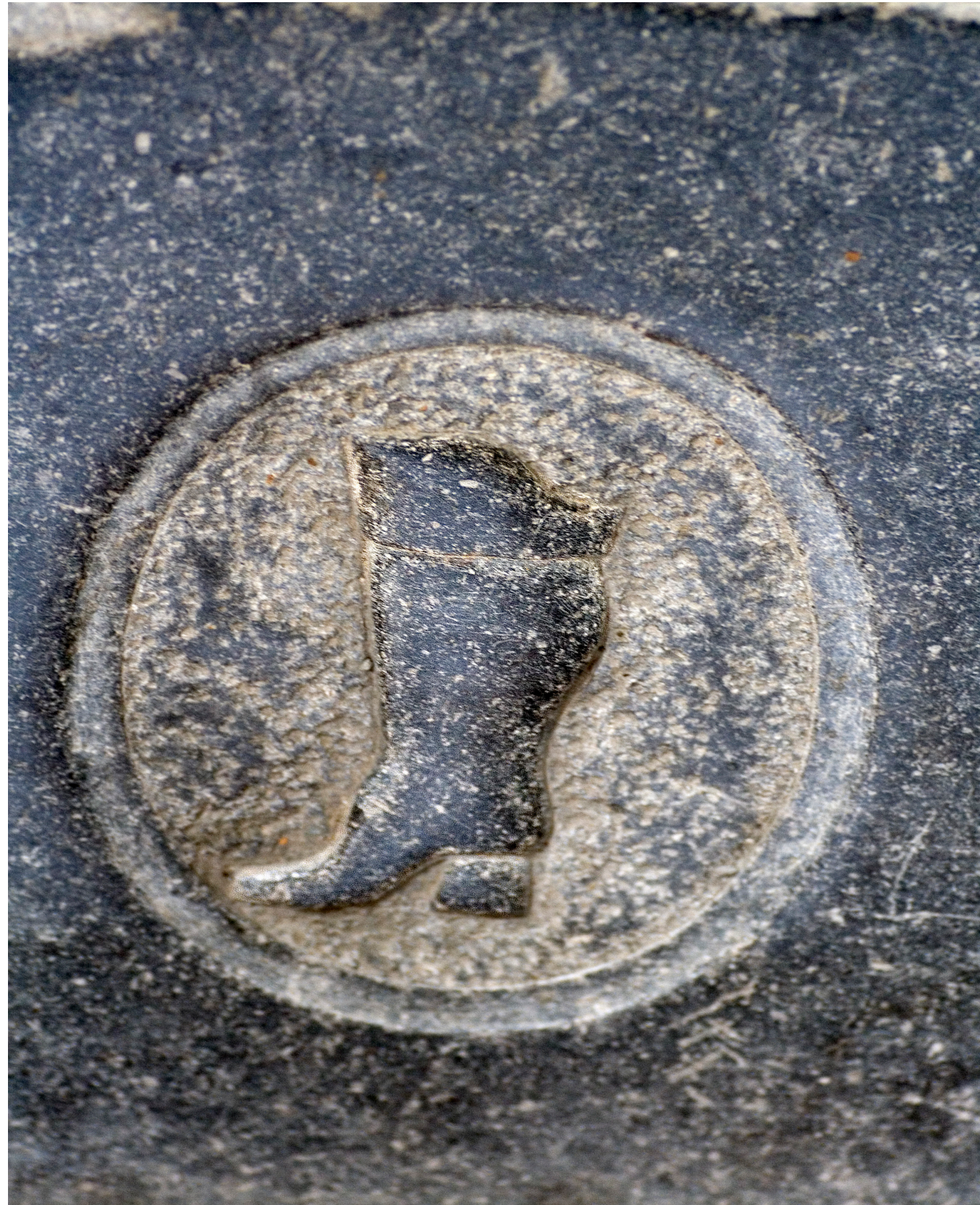
Afb.2 Het gildegraf van de schoenmakers in de Grote Kerk van Dordrecht